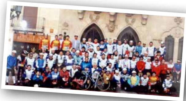
FOTOGRAFIA DEL CLUB CICLISTA GRANOLLERS DELS ANYS 80

El Club Ciclista Granollers fundat el 1972 celebra aquest any el 40è aniversari d'una de les seves proves reina la Marxa Cicloturista Internacional Rutes del Montseny. Es tracta d'una de les proves clàssiques de Catalunya que transcorre pel Parc Natural del Montseny, i amb el repte d'assolir dos ports de muntanya. La 40a edició es farà el diumenge 5 d'abril, amb recorreguts de 106 Km o 153 Km. Les inscripcions es poden fer en aquesta web rutesdelmontseny.com .