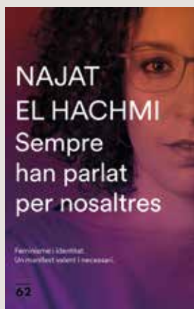
Portada de l’últim llibre de Najat El Hachmi, Sempre han parlat per nosaltres , un assaig sobre feminisme i identitat que denuncia les formes de discriminació que pateixen les dones.

Sí, i moltes et diuen que el porten voluntàriament després de patir una pressió tremenda. L’escola, sobretot la primària, hauria de preservar un espai d’igualtat entre nens i nenes. No té cap sentit que una nena de P3, 1r o 2n porti mocador i a alguns llocs està passant. Això no se sosté des de cap punt de vista, ni religiós, ni cultural. A mi l’escola em va educar en la igualtat i em va donar les eines per entendre aquesta estructura heretada del patriarcat, que forma part de totes les cultures.