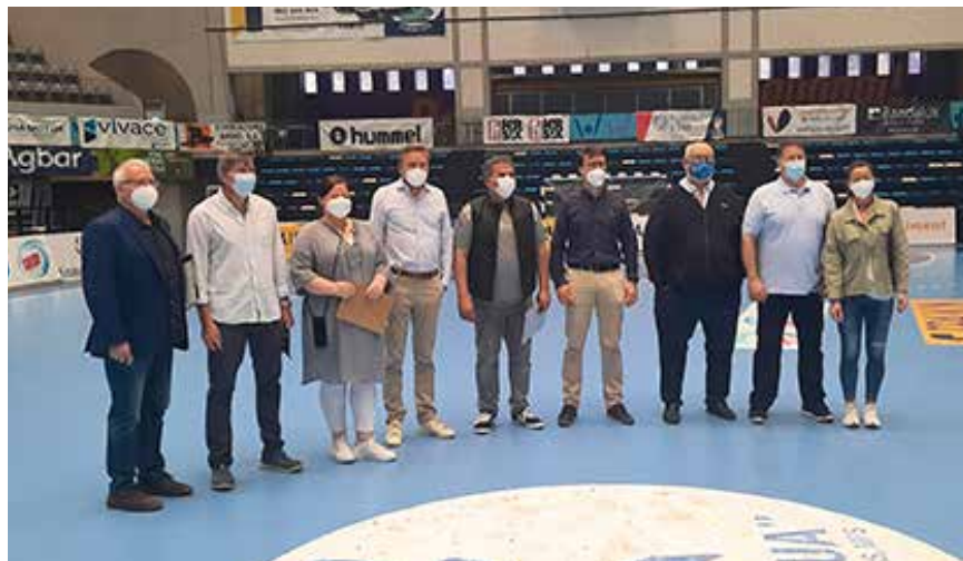
La delegació responsable de fer la inspecció al Palau, abans de començar la visita

Del 2 al 19 de desembre de 2021, la ciutat acollirà el que és considerat el quart esdeveniment d'esport femení amb més repercussió mundial. Per aquesta gran fita és indispensable tenir el