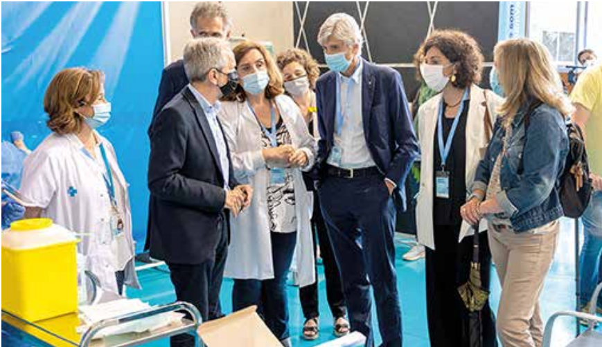
El conseller de Salut, Josep Maria Argimon, ha visitat el nou punt de vacunació massiva que s'ha posat en marxa el dimarts 1 de juny

El Palau d'Esports de Granollers, al carrer dels Voluntaris 92, núm. 2, és el nou punt de vacunació massiva per donar cobertura a la població del Vallès Oriental i de la resta de comarques de la Regió Sanitària Metropolitana Nord (Vallès Occidental, Barcelonès Nord i Maresme). Disposa de 6 mòduls, amb 3 punts de vacunació a cada mòdul (18 punts en total), zona de recepció i acreditació, 3 zones d'observació per a després de l'administració de la vacuna i un espai per a l'atenció mèdica del Sistema d'Emergències Mèdiques (SEM). La capacitat total de vacunació d'aquest punt pot arribar fins a les 25.000 vacunes setmanals. L'horari de vacunació és de dilluns a dissabte,