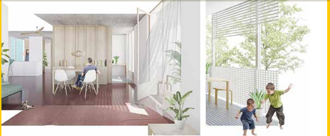
Imatges virtuals de l'edifici de lloguer assequible que es construirà al pg. de la Muntanya, 187

L'Ajuntament construirà directament 17 habitatges de lloguer assequible en un edifici situat a la cantonada entre el pg. de la Muntanya i l'av. Francesc Ribas. Tots els habitatges tindran entre 70 i 75 m 2 de superfície útil, disposaran de tres habitacions, dos lavabos i balcó-galeria, a més de places d'aparcament soterrat. Es preveu comptar amb el projecte d'execució de l'edifici la propera tardor i iniciar les obres de construcció durant el primer trimestre de 2022.