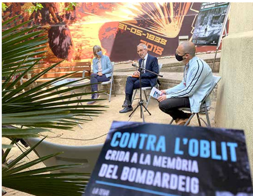
Presentació del projecte del diari col·lectiu del bombardeig de Granollers

En els darrers anys, s'ha treballat per recuperar la memòria oral, gràfica i documental de la guerra civil i dels bombardejos de Granollers, uns recursos que complementen la recerca històrica dels historiadors. Actualment, més de quaranta persones ens han deixat el seu testimoni en forma d'entrevista audiovisual i moltes d'altres han aportat documents personals. Aquest patrimoni, que es pot consultar al portal web de l'Arxiu Municipal, juntament amb la feina dels historiadors per documentar i explicar els fets, han contribuït de manera decisiva al coneixement dels fets tràgics que van marcar la història de la ciutat i de la seva gent. El 25 de maig es va presentar en roda de premsa