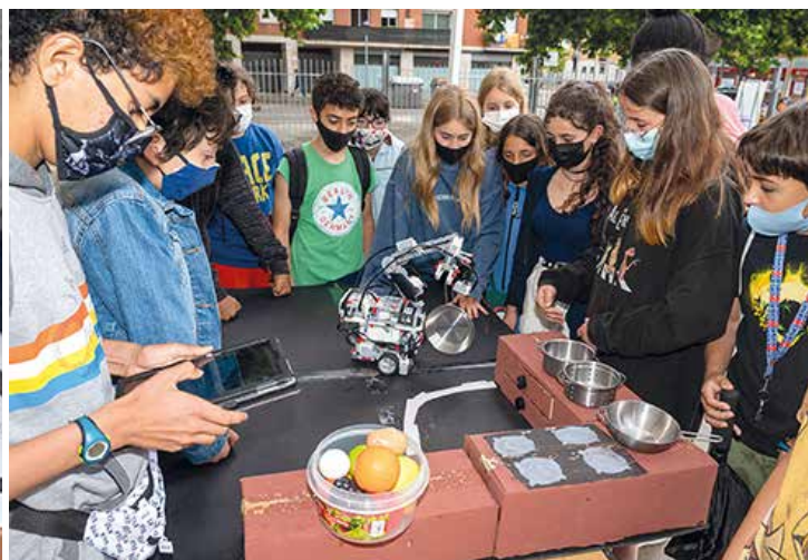
La 4a edició de la VallèsBot es va fer a les pistes exteriors del Palau d'Esports de Granollers

El passat 24 de maig es va celebrar a les pistes exteriors del Palau d'Esports de Granollers, la 4a edició de la VallèsBot. La jornada, organitzada pel Servei Educatiu del Vallès Oriental i l'Ajuntament de Granollers, amb el suport dels ajuntaments de Canovelles, les Franqueses del Vallès i la Roca del Vallès, va comptar amb la participació de 17 centres de primària i secundària –9 d'ells de Granollers– que van presentar un total de 28 projectes. La participació va ser inferior que en passades edicions però, atesa la situació provocada per la Covid-19, es va valorar molt positivament que 700 alumnes s'hi hagin sumat. Enguany la jornada va tenir com a temàtica el món de la gent gran amb l'objectiu que