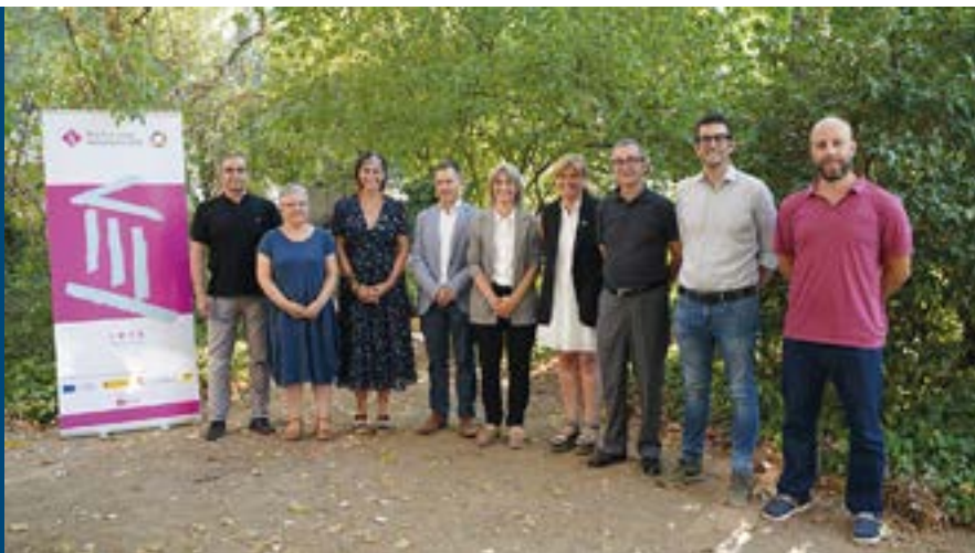
Presentació del document “Missions Granollers 2030” el 13 de juliol passat al Museu de Ciències Naturals

El Ple de juliol de 2021 va aprovar per unanimitat el document d'orientació i organització del 3r Pla Estratègic de Granollers, un pla d'acció local amb sentit global. Després d'un procés de treball de 8 mesos que ha comptat amb la participació de més de 1.400 persones, l'encàrrec s'ha materialitzat en el document “Missions Granollers 2030”, aprovat també per unanimitat al Ple del passat mes de juny. A partir d'aquí, s'elaboraran projectes concrets que han de permetre assolir les missions i fites plantejades.