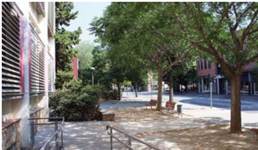
A l'escola Salvador Llobet s'ha habilitat un pas amb paviment de formigó davant la rampa d'accés

Com cada any, l'Ajuntament ha aprofitat els mesos d'estiu per fer obres i treballs de manteniment als diferents centres educatius municipals, per tenir-los a punt de cara a l'inici del curs escolar al setembre. S'han fet actuacions de millora per valor de 150.000 euros.