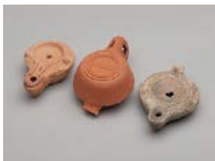
Algunes de les peces que formen part de l'exposició (d'esquerra a dreta): conjunt de llànties trobades a Granollers, cap de Bacus jove i àmfores vinàries

Tot plegat s'acompanya de reconstruccions en 3D per ajudar a il·lustrar tot allò que encara avui continua sota terra o que ha desaparegut irreversiblement. Un audiovisual inèdit