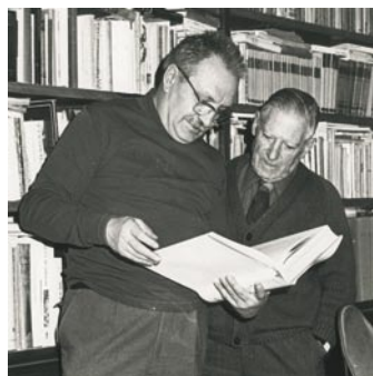
Antoni Cumella amb el també ceramista Josep Llorens Artigas

Antoni Cumella i Serret (Granollers, 1913-1985) és un dels granollerins més universals. Creu de Sant Jordi de la Generalitat, medalla d'or del FAD i fill predilecte de Granollers (1982), entre els seus premis hi ha tres medalles d'or a la Trienal d'Art de Milà (1936, 1951 i 1957), medalla de plata de la I Exposició Nacional de Artes Decorativas (1945), el Premi de Cuba a la II Biall Hispanoamericana de Arte (1954), el Premi de la crítica a la millor exposició de l'any a Barcelona (1974) i el I Premi Nacional d'Arts Plàstiques (1980). Aprèn l'ofici de terrisser