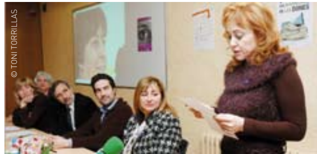
Acte de cloenda de la segona edició del projecte Francesca Martín

La falta de vehicle també és un handicap que tenen la majoria de les 43 participants en el Projecte Baobab d'inserció laboral per a dones immigrants extracomunitàries (la majoria de Senegal, Gàmbia i Mali i minoritàriament de Marroc), que s'ha fet per quart any. El projecte pren el nom de l'arbre poderós i gegantí dels africans i té molts paral·lelismes amb l'anterior, ja que també busca l'autonomia personal i donar eines per a la inserció laboral: "Si no participen en l'economia familiar no són res",