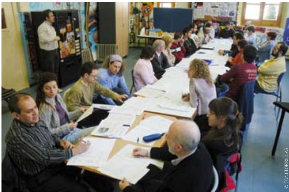
Segona sessió de la presentació de projectes al Consell Municipal de Cooperació i Solidaritat, el 25 de març d'aquest any

Aquest Consell vehicula polítiques municipals, promou la pau, la solidaritat i el respecte als drets humans, dona suport a les entitats dedicades a aquestes actuacions i assessora l'Ajuntament sobre projectes solidaris, campanyes d'emergència i activitats derivades. És la tasca principal del Consell Municipal de Cooperació i Solidaritat, que prioritza en funció de criteris d'acció humanitària, com ha estat el cas dels ajuts d'emergència destinats a pal·liar els efectes de les inundacions en els