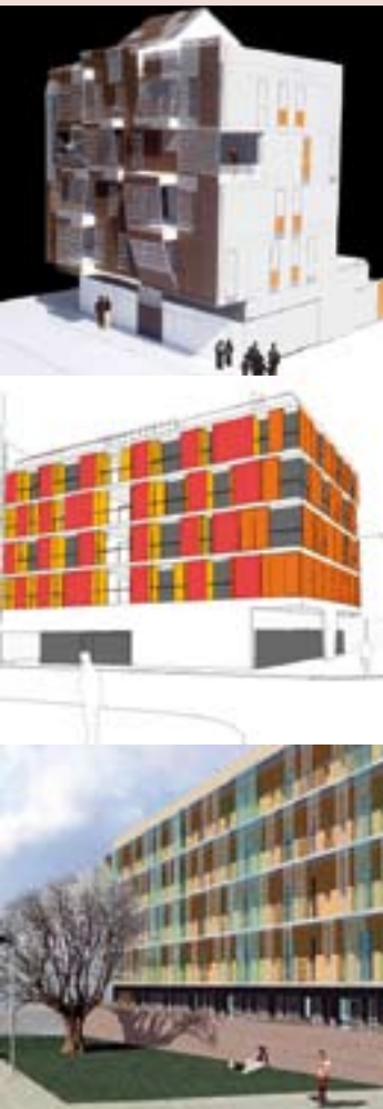
A la dreta, cantonada del c. del Molí amb el c. d'Annibal (Can Comas) on es construiran 19 habitatges de promoció municipal