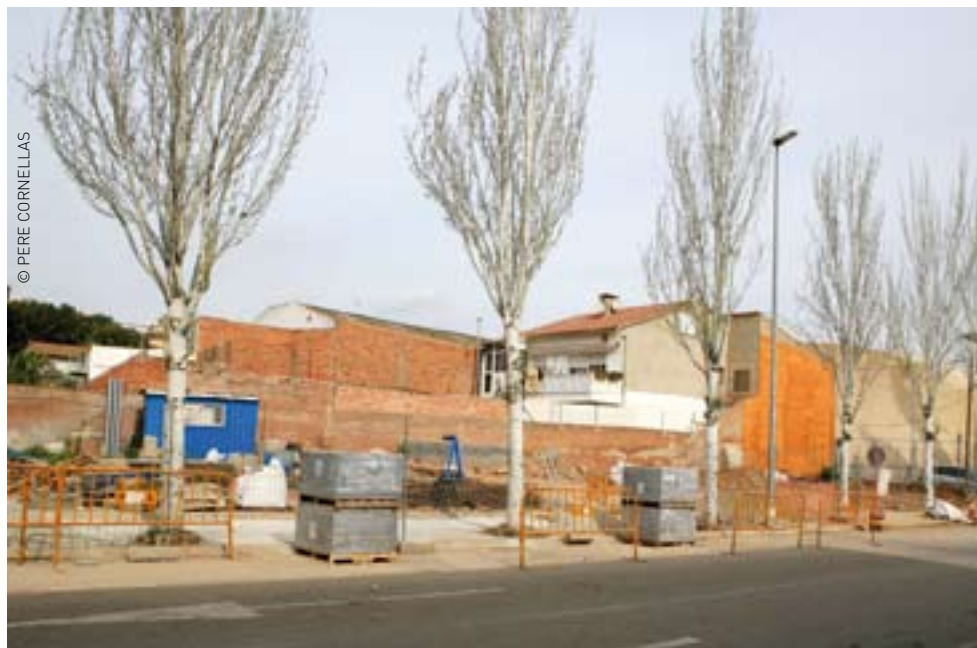
Solar del carrer de Maria Palau on s'edificaran 12 habitatges

compravenda i 10% una vegada visat el corresponent contracte privat de compravenda per la Direcció General d'Habitatge. El pagament del preu de venda restant, més l'IVA corresponent, es farà en el moment de fer l'escriptura pública de la compravenda mitjançant el crèdit hipotecari corresponent.