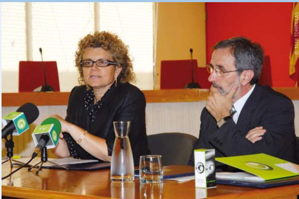
La consellera Geli explicant el contingut del Pacte de Ciutat

La consellera de Salut, Marina Geli, i l'alcalde de Granollers, Josep Mayoral, han signat el Pacte de Ciutat, un conveni de col·laboració que compromet el Departament de Salut i l'Ajuntament de Granollers a la millora de la qualitat de la xarxa sanitària de la ciutat. El Pacte de Ciutat de Granollers inclou inversions importants que es materialitzaran en els propers anys. El Servei Català de la Salut promourà la construcció d'un nou centre d'atenció primària, un