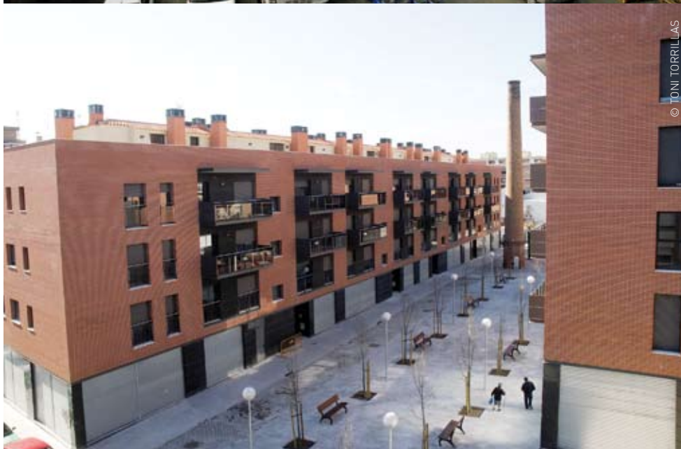
A dalt, fotografia de l'any 2003 de Can Casanoves. A baix, la mateixa zona, urbanitzada