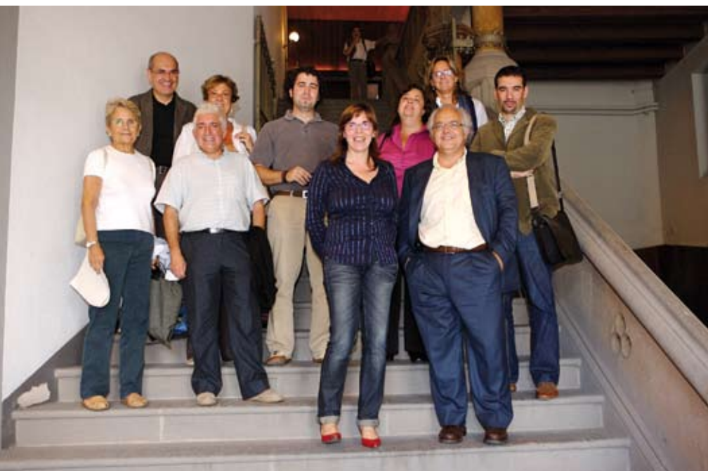
Integrants de la comissió de seguiment del congrés de ciutats educadores Granollers 2009