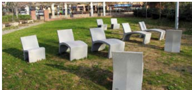
El parc de Ponent i el bosc de Can Ferran, espais que arranjaran els alumnes del taller d'ocupació

Dels 38 alumnes, d'entre 26 i 59 anys, 20 són homes i 18 dones, majoritàriament catalans i també marroquins i d'altres nacionalitats. Uns i altres estaven en situació d'atur, inscrits a l'Oficina de Treball de la Generalitat i eren usuaris de Granollers Mercat. 8 dels alumnes, que formen part del mòdul de jardineria, són persones que pateixen un trastorn mental i han estat seleccionades per l'Oficina Tècnica Laboral de Granollers, de recent creació, procedents del Centre de Salut Mental Benito Menni i del Centre de Rehabilitació Prelaboral.