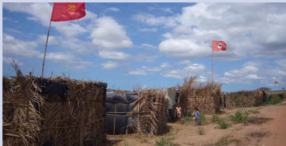
Exposició Terra do Brasil, al Gra