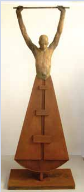
Vencedor, de Jesús Curia

SALA D'ACTES ■ El bé i el mal a les festes populars, de M. Ángeles Sánchez Del 19 de novembre al 19 de desembre Inaug.: dia 19, a les 20 h