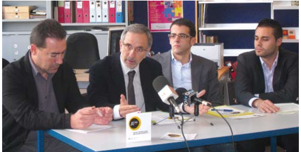
Representants de les tres administracions que fan possible l'oficina (Generalitat, Consell Comarcal i Ajuntament) explicant els resultats del primer semestre

L'assessoria laboral ha atès 1.300 joves, entre els 900 alumnes de secundària que han participat a la cinquantena de xerrades organitzades (sobre treballar a l'estranger, fer un videocurrículum, com superar una entrevista de feina, treballar de monitor,...) i els que han fet consultes individualitzades, més de 400 joves (el doble de l'any passat). D'aquests, 275 es trobaven en situació d'atur, 96 estudiaven i 35, treballaven. Per edat, la franja de 16 a 23 anys és la més nombrosa (217 persones), seguida de la de 24