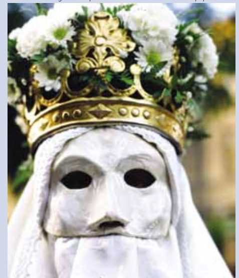
Imatge de l'exposició El bé i el mal a les festes populars

■ L'arbre. El gegant del regne vegetal Producció: Joan Condal Fins al 9 de gener de 2011