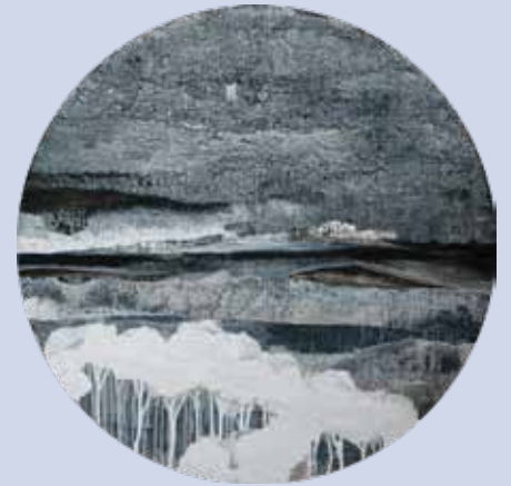
Paisatge metafòric II

■ Obres amb guardó. Paisatge metafòric II, de Rafael Lamas Premi de Pintura Paco Merino (4a edició) Fins al 9 de gener de 2011