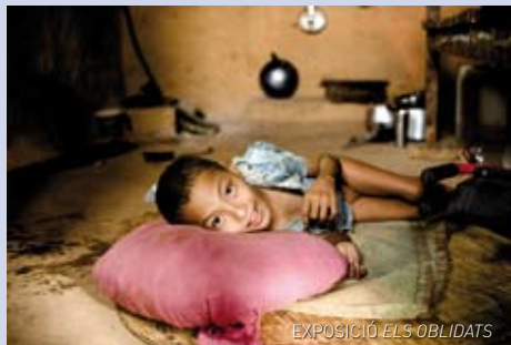
EXPOSICIÓ ELS OBLIDATS