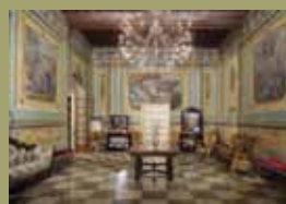
Durant el curs es visitarà la Casa Fontcoberta de Vic, exemple de casa senyorial del segle XVIII.

El Museu de Granollers té diverses propostes per a aquest mes. El dia 2 de març, a les 7 de la tarda, hi haurà una visita comentada a l'exposició “Passant pàgina. El llibre com a territori d'art”, amb un dels comissaris, Òscar Guayabero. L'endemà, dissabte dia 3, sessió d'El Barret de les Històries, amb el conte infantil L'escut dels Masferrer .