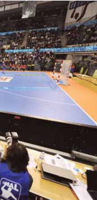
Acollir esdeveniments, com el Mundial d'Handbol de 2013, i fomentar el turisme de reunions i congressos posant en valor la bona planta hotelera de la ciutat és un dels objectius definits en el PAM

ciutat de qualitat hi ha, entre d'altres, executar la remodelació de la planta sotterrani del Mercat de Sant Carles; construir i posar en marxa els habitatges dotacionals del Pla de Baix; aplicar la carta de colors de la ciutat per millorar façanes i mitgeres d'edificis; una nova ordenança del paisatge de Granollers; iniciar la urbanització dels carrers de Roca Umbert; elaborar el projecte d'una residència per a la gent gran al carrer de Tetuan, d'acord amb la Generalitat; urbanitzar el tram més industrial del carrer de Lluís Companys; fer el projecte de reurbanització del carrer de Girona; acabar la reurbanització del passeig de la Muntanya, remodelar els vestidors i el parquet del Palau Olímpic; posar gespa artificial al camp municipal de la Font Verda; i reformar l'accés a l'Hospital.