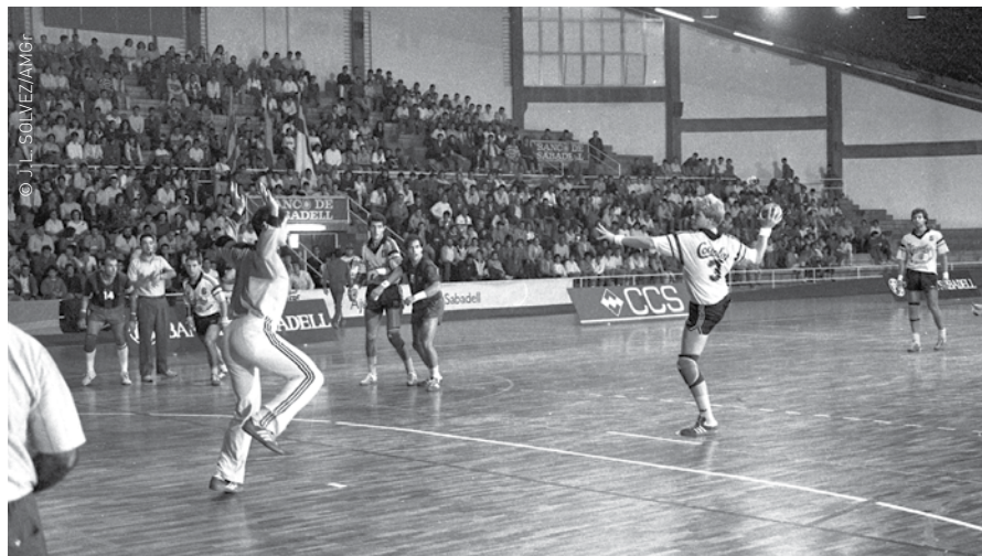
Final de la Copa Catalana, entre el BM Granollers i el Barça, el 21 d'octubre de 1987

Més de 15.900 imatges captades pel fotògraf Josep Lluís Solvez Resina entre els anys 1987 i 2004 integren el nou Fons Solvez de l'Arxiu Municipal de Granollers. En concret, es tracta de 15.870 negatius (de 35 mm) i 50 positius (de 10x15 i de 13x18 cm), tant en color com en blanc i negre, i, la major part, sobre la competició del Club Balonmano Granollers. També en formen part imatges de l'activitat esportiva de l'Esport Club Granollers i del Club Bàsquet Granollers.