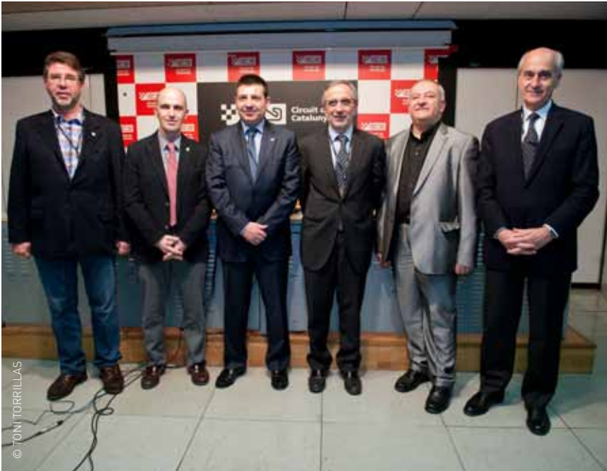
El director del Circuit, els alcaldes de Parets del Vallès, Montmeló, Granollers i els presidents del Consell Comarcal i del Circuit

Aprofitar l'oportunitat econòmica i social que ofereix el Circuit de Catalunya és un dels objectius principals que s'han marcat els municipis de Parets del Vallès, Granollers i Montmeló, juntament amb el Consell Comarcal del Vallès Oriental, a l'hora de crear l'Associació de Municipis Parc Territorial del Circuit. Aquesta entitat treballarà conjuntament amb empresaris, restauradors, associacions, sindicats, indústria i d'altres ens implicats per dissenyar una estratègia que generi beneficis en l'àmbit esportiu, social i econòmic als municipis que envolten l'equipament. Els tres consistoris coordinaran i impulsaran les actuacions d'abast municipal en l'àmbit territorial del Circuit com ara l'estudi urbanístic del sector, la recerca de sistemes per a la creació de noves oportunitats o l'impuls dels consells de participació sectorial. Així els membres de l'Associació de Municipis Parc Territorial del Circuit portaran a terme l'anàlisi urbanística de l'àrea i la detecció de les potencialitats de l'entorn com noves oportunitats econòmiques, esportives, culturals, hoteleres, d'infraestructures, paisatgístiques o ambientals. I, la coordinació dels planejaments municipals sobre el Circuit i l'entorn amb un marc d'ordenació amb criteris homogenis i coherents.