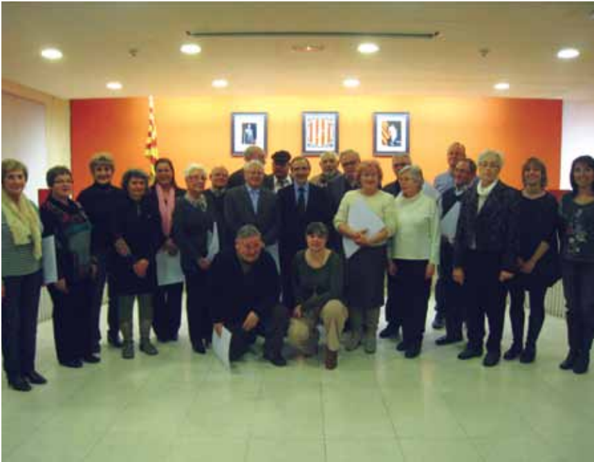
Foto de grup, durant l'acte públic d'agraïment

2.599 documents i 4,63 m lineals d'impresos (llibres, revistes, fullets i cartells) i manuscrits. Aquest és el material dipositat a l'Arxiu Municipal de Granollers amb els 33 ingressos fets durant l'any 2011. Es tracta d'aportacions diverses, de 1920 i fins a l'actualitat: documents per a reproducció, textuais i icònics (243 imatges digitalitzades, 37 postals i 2.319 fotografies, 1.332 en suport paper, 953 negatius i 34 diapositives). Bona part d'aquestes aportacions les han fet vint-i-sis persones, vuit de les quals ja fa anys que fan possible l'increment dels fons de l'Arxiu Municipal, amb donacions diverses, incorporades a aquest equipament i a l'Hemeroteca Municipal Josep Móra.