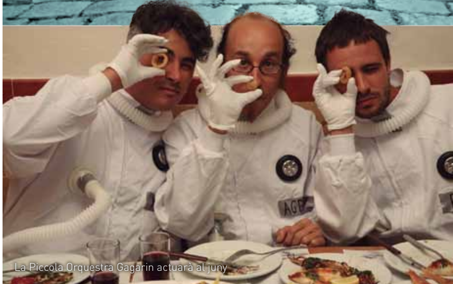
La Piccola Orquestra Gagarin actuarà al juny