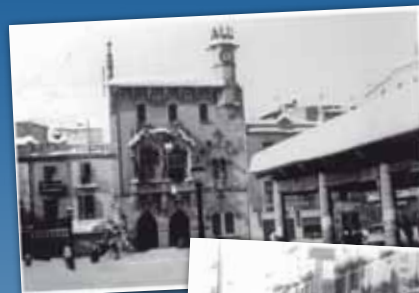
PLAÇA DE LA PORXADA, DESEMBRE 1962.