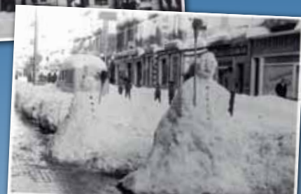
ANSELM CLAVÉ, DESEMBRE 1962.