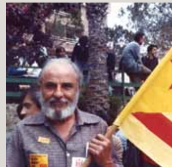
A dalt, en un homenatge al músic Miquel Vilà organitzat per l'Agrupació Sardanista, 1972. Al mig, en la celebració de la caravana de la flama de la sardana, 1972. A sota, en una manifestació