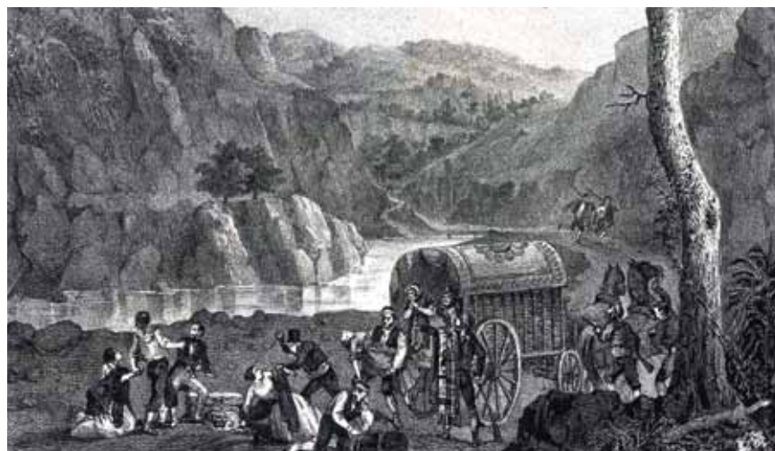
Pas del Congost. Gravat de J. Donon. MdG