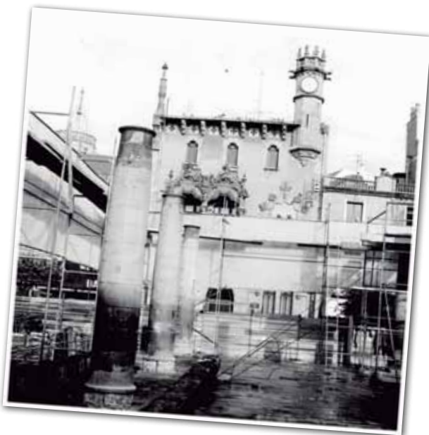
OBRES DE RESTAURACIÓ DE LA PORXADA, 1985.

A petició de l'Ajuntament, la Diputació de Barcelona va plantejar la reparació com una estricta recuperació d'aquest edifici renaixentista de Bartomeu Brufalt, sense oblidar, a més, el seu valor emblemàtic. Per tant, es van aprofitar alguns elements que estaven en bon estat i es va reconstruir l'estructura de fusta d'acord amb l'esquema original. Tot i així, es va haver de refer cavallets i gerres de ceràmica vidrada i d'amagar la conducció elèctrica dins d'una columna del perímetre, a més de pavimentar de nou el terra amb lloses de pedra. La Porxada va quedar reconstruïda després d'un any d'obres.