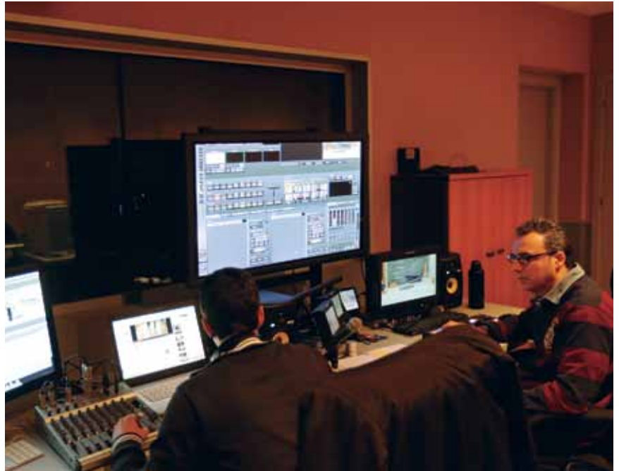
La sala de Post producció del Centre Audiovisual

El panorama audiovisual és canviant i la crisi econòmica agreuja la situació del sector. Les