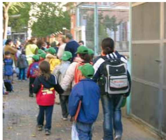
Part de les activitats de Creu Roja es financen amb el Pla de xoc. Més de mil infants s'han pogut acollir a beques gràcies a l'aportació suplementària del Pla de xoc.

En el pressupost municipal de 2015, l'Ajuntament tornarà a destinar un milió d'euros per continuar les mesures destinades als col·lectius amb més dificultats