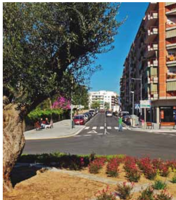
Els Reis d'Orient sortiran aquest any del renovat passeig de la Muntanya, que s'engalanarà amb llums de Nadal

Els treballs han tingut una durada de sis mesos. La Diputació de Barcelona ha finançat la major part de l'obra