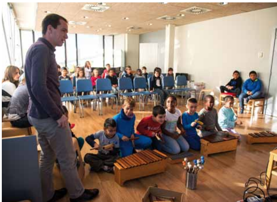
Alumnes de cycle inicial de l’Escola Ponent en el Taller Banda Sonora Molt Original

En els gairebé dos anys que porta de vida, aquest projecte ha posat les bases de la seva continuïtat. Algunes propostes, però, són ja una realitat: setmanes temàtiques a l’entorn de la connexió entre música i altres disciplines (matemàtiques, llenguatge, arquitectura...), edició de material didàctic, tallers per escolars de primària i secundària, musicoteràpia per als alumnes del Centre Montserrat Montero i els joves del Centre de Rehabilitació Comunitària de Granollers, sessions familiars i assaigs oberts organitzats per l’Orquestra de Cambra, activitats pels joves músics usuaris de Roca Umbert... El projecte arribà, en el seu primer any de vida, a més de 4.000 persones: infants, nens i adults.