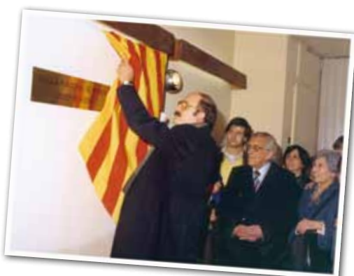
DESCOBERTA DE LA PLACA DE L'ESCOLA MUNICIPAL DE MÚSICA JOSEP M. RUERA EL 16 DE GENER DE 1983.