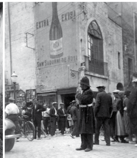
A l'esquerra, l'antiga Capella dels Sants Metges al carrer de Corró, 1913. A la dreta, Capella de Sant Roc, 1928.

Bell-lloc, de la Roca, de Barcelona, de Caldes i de Corró, sobre els quals es van construir les capelles, el segle XVI, dedicades a l'advocació d'un sant o una santa. Aquest va ser l'origen de les capelles de Sant Roc, de Santa Esperança, de Sant Cristòfol, de Santa Anna i de Sant Antoni –més endavant, de Santa Elisabet–, algunes conservades en una ubicació propera a la inicial. La devoció per aquests sants va ser tan gran que els portals van perdre la seva denominació original a favor del nom del sant i van originar els sants de barri, durant els quals es feien sonores i celebrades festes. Aquesta exposició il·lustra, doncs, part de la història de les antigues capelles de muralla de Granollers.