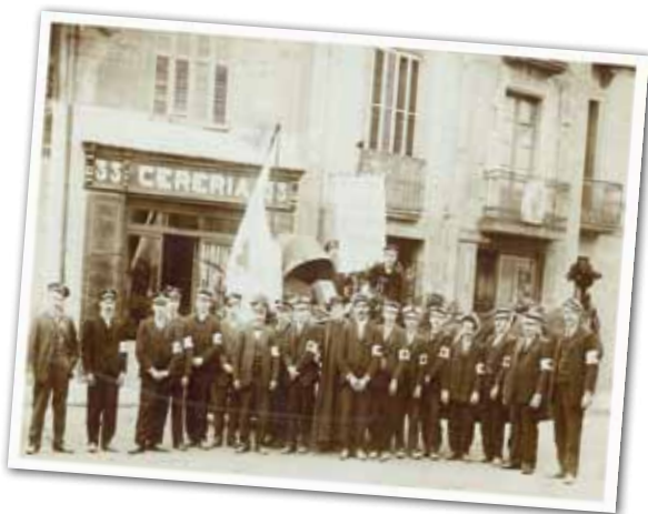
INTEGRANTS DE LA CREU ROJA DE GRANOLLERS AMB UN GRUP DE REPRESENTANTS DE LA CREU ROJA SICILIANA, 1916. (ASSEMBLEA COMARCAL DE LA CREU ROJA A GRANOLLERS)

Aquest mes de setembre es compleixen 110 anys de la fundació de l'Assemblea Local de Creu Roja Granollers. Avui continua prestant un servei essencial. Una de les prioritats d'aquesta institució humanitària ha estat donar continuïtat aquest estiu a l'ajuda alimentària per als infants més vulnerables, a partir d'un programa coordinat amb l'Ajuntament de Granollers.