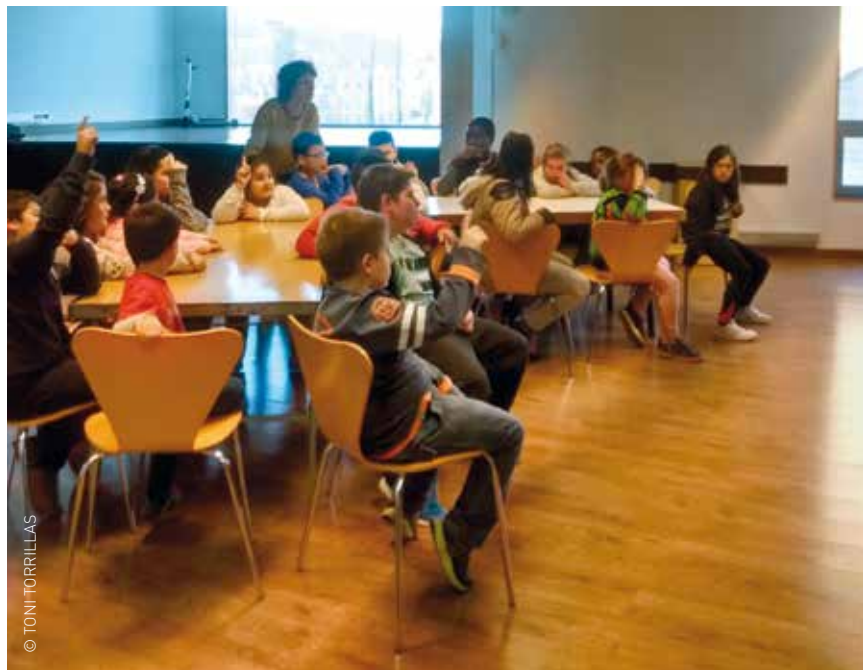
Fins ara, 44 infants i les seves famílies s'han beneficiat del programa Afis Pediàtric que tracta l'obesitat infantil des de diferents disciplines. A la imatge, una sessió del curs passat.

Aquest mes d'octubre s'inicia la tercera edició del programa Afis Pediàtric que porten a terme els serveis de Salut Pública i Esports de l'Ajuntament de Granollers, i els serveis de Pediatria de l'ICS.