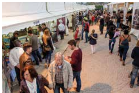
Imatges de l'Ascensió 2016.

de gossos de rescat a càrrec de l'associació de Recerca i Rescat caní de Granollers.