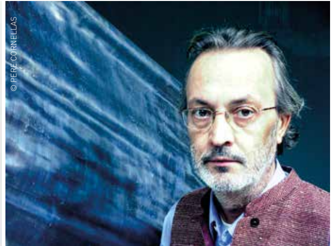
L'obra de Benito a través de la qual en sorgirà la instal·lació permanent al parc de Ponent

Dissabte 21 d'abril a les 12 hores s'inaugura al parc de Ponent la instal·lació permanent a partir d'una obra projectada per l'artista granollerí internacional, Jordi Benito. S'està habilitant el parc per rebre els diferents elements que formen la instal·lació a l'entorn del llac del parc de Ponent i consta de quatre peces: