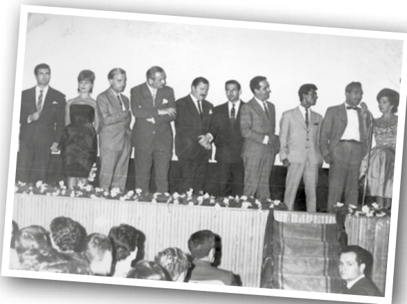
V SETMANA DEL CINEMA ESPANYOL AL CINEMA ASTÒRIA, 1961.

ta, es va convertir en el millor cinema local i era també on el cineclub de l'AC portava a terme la projecció de pel·lícules i els debats posteriors a la dècada dels seixanta. En la sessió inaugural del cinema s'hi va estrenar Y después del cuplé , amb Marujita Díaz i Tony Leblanc com a protagonistes i Los implacables , amb Clark Gable i Jane Russell. Era l'època en què hi havia doble sessió de cinema i la gent hi anava molt sovint. L'Astoria també va ser un dels escenaris de la Semana del Cine Español que es va celebrar entre els anys 1957 i 1976. L'última sessió de l'Astoria va ser el 23 de maig de 1982.