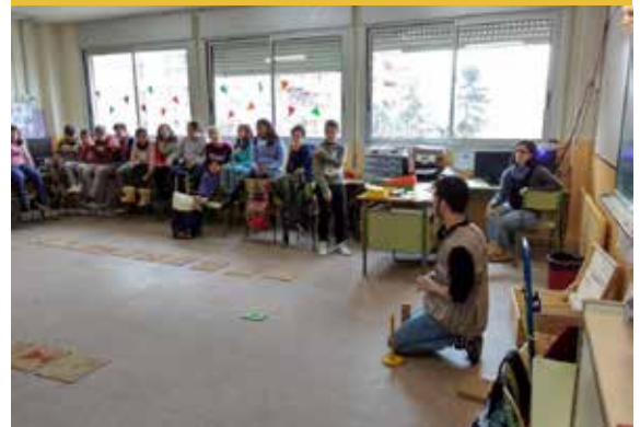
Taller amb el joc Activat per promoure l'estalvi d'energia amb alumnes de l'escola Salvador Espriu, el febrer passat.

En aquest sentit, l'EMT està dissenyant un projecte d'estalvi energètic per al curs vinent i ha fet una proposta a través dels pressupostos participatius per instal·lar plaques solars fotovoltaïques a la coberta per produir electricitat per a l'autoconsum.