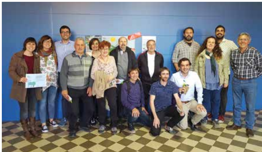
Participants a la campanya Denominació Energètica Palou, que va celebrar-se el passat mes de març

Aquesta pregunta centra l'objectiu del projecte Interreg MED COMPOSE, de què l'Ajuntament de Granollers és soci i amb el qual es pretén incrementar la presència d'energies renovables en la presa de decisions i els instruments de planificació, i afavorir el creixement de models de negoci i empreses d'economia verda, amb la connexió del potencial local de generació d'energies renovables i les xarxes de distribució. Amb aquesta finalitat, a Granollers i onze territoris més d'Europa es treballa en una estratègia d'inversió per desenvolupar les energies renovables i les mesures d'eficiència energètica.