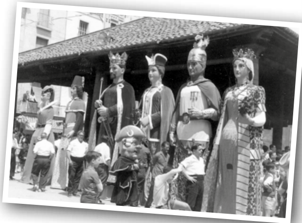
PRESENTACIÓ DELS GEGANTS ESTEVE I PLÀCIDA, 19 DE MAIG DE 1968.

L'Esteve i la Plàcida són unes figures reials que representen, històricament, dos reis catalans del final de la Reconquesta catalana. Actualment l'Esteve i la Plàcida participen en la Festa Major de Blaus i Blancs i a la Fira i Festes de l'Ascensió. L'entitat Amics dels Gegants i Capgrossos de Granollers té cura de preservar i mantenir les dues parelles de gegants de la ciutat.