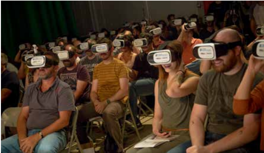
Una de les activitats del MAC 2017