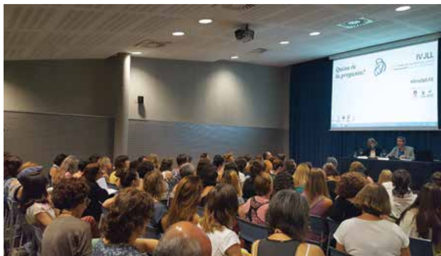
Imatge de la inauguració de les IV Jornades de Laboratoris de Lectura

Els dies 29 i 30 de juny la Biblioteca de Roca Umbert serà de nou l'escenari de les Jornades de Laboratoris de Lectura, una iniciativa que se celebra cada dos anys i que arriba a la cinquena edició. Les jornades són un punt de trobada de professionals del món de les biblioteques i tenen com a principal objectiu donar a conèixer la feina dels laboratoris de lectura d'arreu del país com a font de recursos i bones pràctiques per promoure la lectura entre els infants.