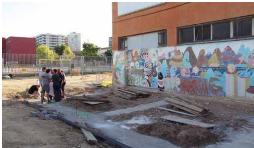
Obres d'ampliació i reforma del taller de mecanització de l'institut EMT

El dimecres 12 de setembre comença el nou curs escolar 2018/2019. A Granollers s'iniciarà amb un total de 6.280 alumnes d'Educació Infantil i Primària i 3.100 d'ESO. D'aquests 9.000 alumnes n'hi haurà més de 600 que començaran P-3 i gairebé 800 que s'iniciaran a l'ESO. El nou curs comença a la ciutat amb el mateix número de grups que l'anterior però el quart grup de 1r d'ESO, que el curs passat hi va haver a l'institut Antoni Cumella, en aquesta ocasió s'ha obert a l'EMT.