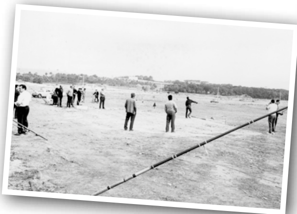
CAMPIONAT DE CATALUNYA DE LLANÇAMENT DE CANYA A PALOU, DURANT LA FIRA DE L'ASCENSIÓ DE 1971.