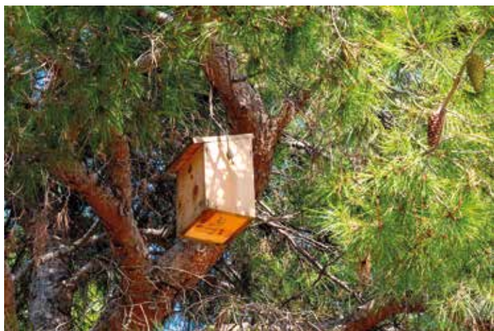
A l'esquerra, caixes niu d'ocells instal·lades al Parc Torras Villà. A la dreta, troncs dipositats a la rotonda del c. Lluís Companys per afavorir la presència d'insectes pol·linitzadors

es plantegen noves plantacions es busquen sempre les espècies més adaptades al medi urbà, poc sensibles a les plagues, a la sequera, i que afectin poc les voreres; tenint sempre en compte estratègies per augmentar el nombre d'espècies i varietats. Per exemple, posar dues espècies diferents en la mateixa alineació o canviar d'espècie en trams de carrers, etc. En aquest sentit, l'any que ve s'elaborarà el Pla director del verd urbà i de l'arbrat, una eina que vol incidir en com s'ha d'estructurar i gestionar el verd municipal en els propers anys. Actualment Granollers té prop de 19.000 arbres públics, la meitat dels quals formant part de carrers i places.