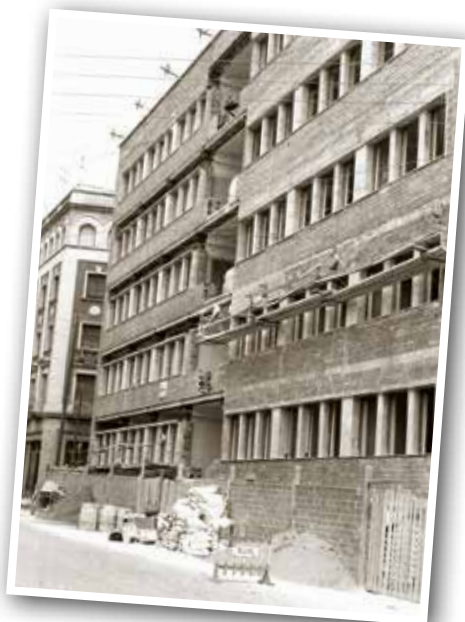
CONSTRUCCIÓ DEL CAP VALLÈS, ANY 1967.

El CAP Vallès Oriental del carrer Museu acaba de celebrar 50 anys. Va ser el primer que es va inaugurar a Granollers. Hi visitaven metges de capçalera i especialistes no hospitalaris. Fins a aquell moment hi havia un ambulatori situat al mateix carrer on s'atenia la població de la zona en les poques consultes de què disposava el local. Des del 1968 el CAP Vallès Oriental s'ha transformat molt, especialment des que l'Estat va traspasar les competències a la Generalitat i va començar a reformar l'atenció primària. El 1980 va ser pioner en el Programa d'Atenció a la Dona (PAD), que inicia l'activitat de prevenció i que el 1992 esdevé l'ASSIR i es va estendre al territori. El 2003 s'incorporen nous metges de família, auxiliars, pediatres i, posteriorment, treballadors socials.