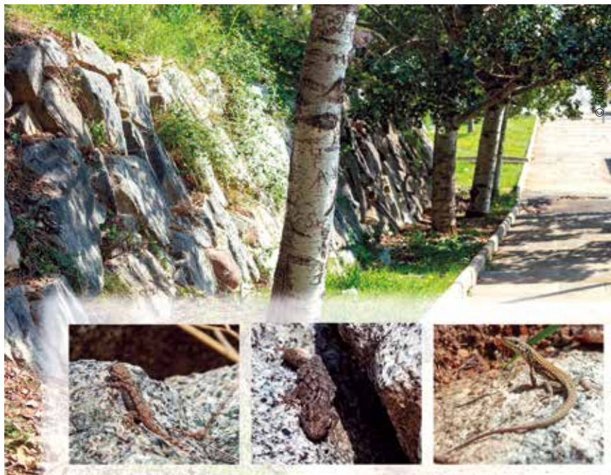
Sargantanes i dracs són depredadors excepcionals d'insectes, per això s'incrementarà el nombre de rocalles i murs de pedra a parcs i jardins, com els que hi ha al Parc del Ramassar

A banda d'aquesta proposta, se seguiran posant jardineres grans com les que ja hi ha als carrers Ricomà, Travesseres, pl. Corona, etc; es plantaran espècies en els escocells dels arbres; i se seguiran plantant arbres en carrers que actualment no en tenen, etc. A més, quan