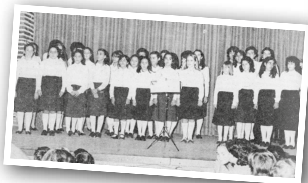
FOTOGRAFIA DE LA CORAL ALBADA PUBLICADA AL SETMANARI "PLAÇA GRAN" L'ABRIL DE 1983