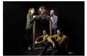
BOIRA A LES ORELLES