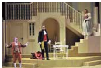
EL BARBER DE SEVILLA