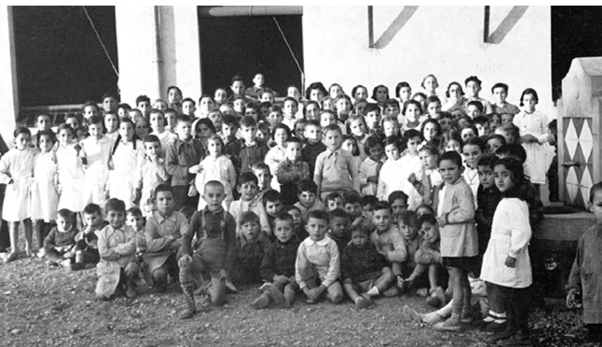
Nens i nenes al pati de les noves escoles, any 1936.