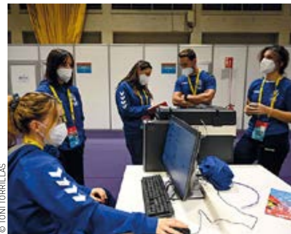
Un Mundial és impossible de gestionar sense la col·laboració de les persones voluntàries. Gairebé 500 van ajudar en diferents tasques, com les que van assistir els mitjans de comunicació o les que elaboraven continguts de comunicació