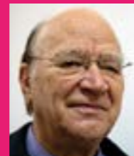
Miquel Roca exvicepresident de l'IHF

"Encara que tothom s'esperava una medalla, la valoració del Mundial és positiva. L'equip està content perquè s'ha treballat molt bé"