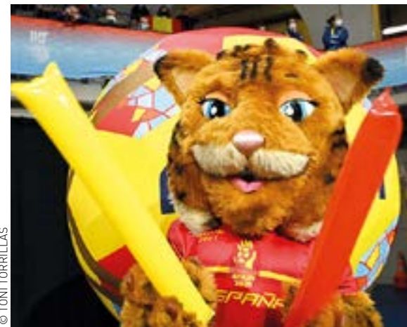
La Lola, mascota oficial del Mundial, ha estat venerada pels més petits i ha animat la gent abans i durant el campionat del món