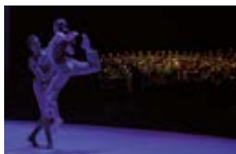
RÈQUIEM DE MOZART