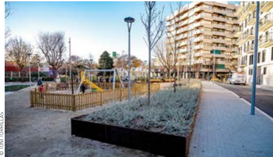
La nova plaça, a la banda sud del carrer de Pompeu Fabra, compta amb una zona de jocs infantils, nous espais verds i bancs per seure

Granollers compta amb una nova plaça que s'ha inaugurat conjuntament amb l'obertura i la prolongació del carrer de Pompeu Fabra. El nou tram té un sol sentit de circulació, de sortida cap a Roger de Flor. Compta amb voreres accessibles de 2 metres d'amplada a banda i banda, passos de vianants a les cantonades i aparcament al costat dret del vial. La segona fase de les obres, iniciada el mes de setembre, correspon al Pla de Millora Urbana 122 i ha estat executada per la promotora encarregada de la construcció dels dos blocs d'habitatges als terrenys de l'antiga central elèctrica d'Endesa. Aquesta segona fase dona continuïtat a les obres de reordenació urbanística que va dur a