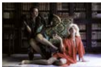
LES DONES SÀVIES