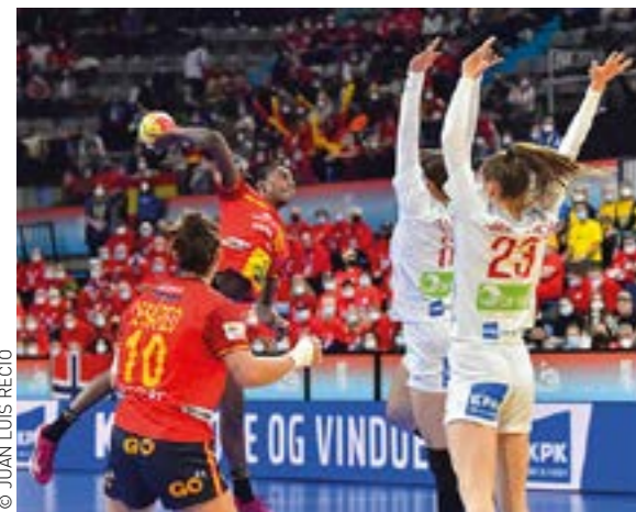
La selecció espanyola va quedar en quarta posició del Mundial. Les daneses les van apartar de la medalla de bronze