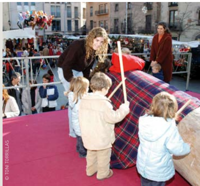
El Tió Solidari, una manera de col·laborar a omplir el rebost del Xiprer

De fet, el magatzem d'aliments dóna resposta a una reorganització de la distribució d'aliments que es feia a cada parròquia. Hem unificat tota la recollida i compra d'aliments d'una forma unitària a fi d'abaratir costos i fer més rendible i eficaç els recursos econòmics de què disposem. Així, els aliments que avui es distribueixen en aquesta zona, dels quals se'n beneficien