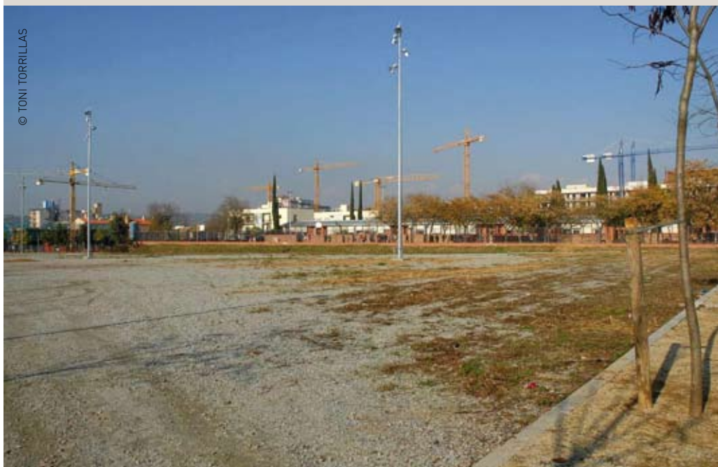
© TONI TORRILLAS Terrenys on es construirà el poliesportiu de Can Bassa-pla de Baix, les obres del qual s'iniciaran el 2007

El bon estat econòmic de l'Ajuntament, que permetrà abordar més inversions finançades amb estalvi corrent i recórrer menys al crèdit, i la voluntat de continuar promovent habitatge públic van ser arguments comuns en les diverses intervencions en el Ple dels partits que conformen l'equip de govern. Aquest any 2007 es preveu lliurar les claus als propietaris dels 108 habitatges que s'estan construint al pla de Baix i iniciar les obres dels 19 habitatges de Can Comas i de l'aparcament públic que es construirà en aquest cèntric espai, per al qual es destinarà aquest any 2,6 milions d'euros. També enguany avançaran les obres de les dues altres promocions amb protecció: els 8 habitatges del carrer de la Font de l'Escot i els 12 del carrer de Maria Palau. A més, el Pla local d'habitatge, que impulsa l'equip de govern, preveu la construcció en els propers sis anys de més de 1.600 habitatges amb algun tipus de protecció pública.