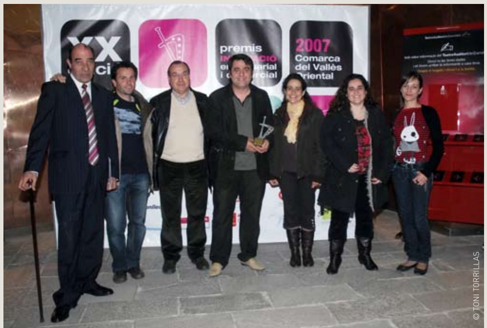
L'equip de DIMAS en l'acte de lliurament dels Premis d'Innovació Empresarial i Comercial

Ara mateix DIMAS compta amb un grup de cinc persones que porten l'empresa: l'àrea econòmica, els