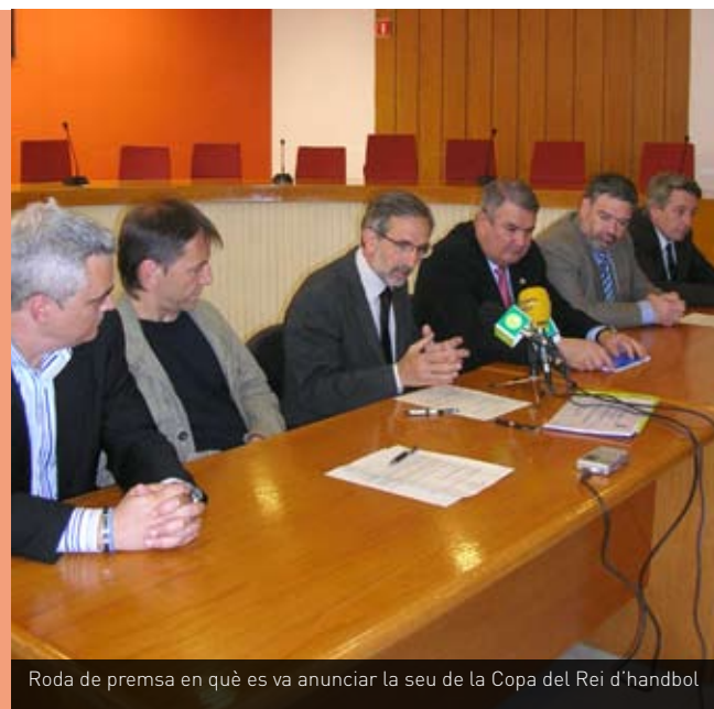
Roda de premsa en què es va anunciar la seu de la Copa del Rei d'handbol