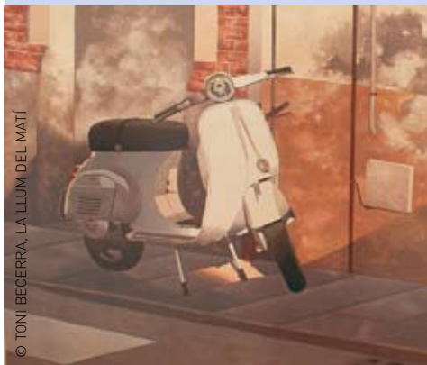
© TONI BECERRA, LA LLUM DEL MATÍ