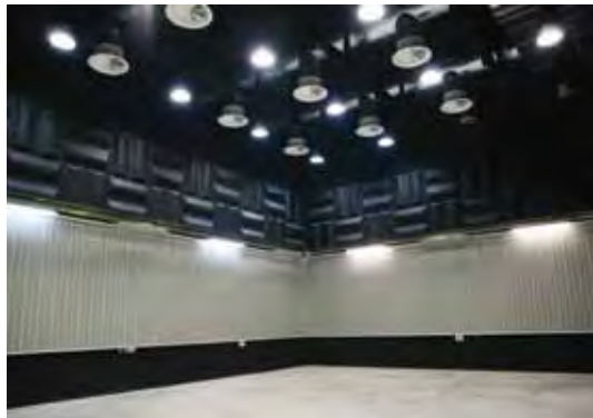
Centre Audiovisual de Roca Umbert