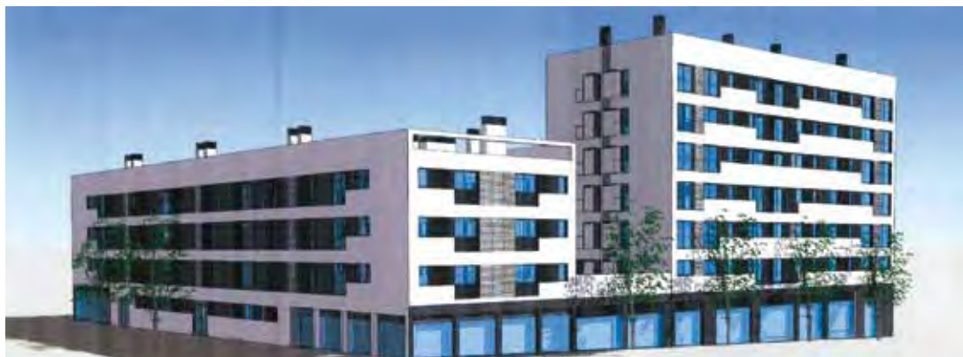
Habitatges de promoció pública al barri del Lledoner

A l'inici d'aquest mandat, l'equip de govern es va comprometre a presentar cada any el programa d'actuacions amb la voluntat de compartir el projecte de ciutat amb la ciutadania. El programa d'actuació municipal 2010-2011 (PAM) presenta un centenar d'accions que es desenvoluparan en aquest període i que emfatitzen les polítiques socials, d'atenció a les persones i de reactivació econòmica. Aquest PAM té la vocació de pal·liar els efectes de la crisi amb una contenció de la despesa corrent, incrementar la despesa social, fer un important esforç inversor i flexibilitzar els cobraments d'impostos i taxes, així com incrementar les bonificacions.