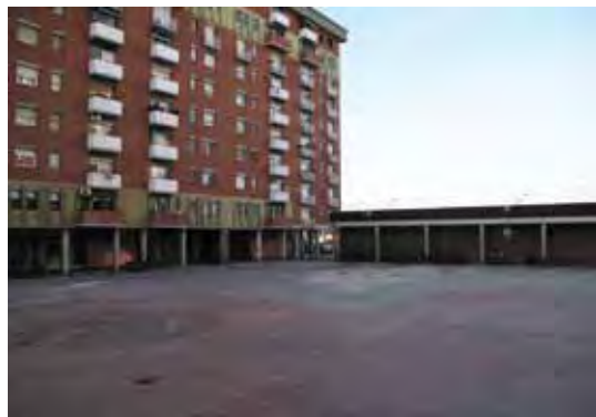
Renovació de la plaça de Can Mònic