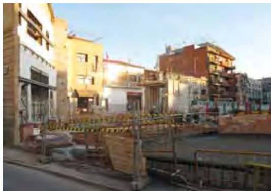
Nou espai públic de Can Comas