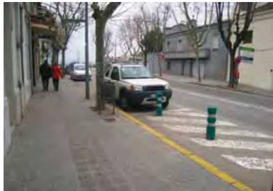
Remodelació de les voreres, passeig de la Muntanya