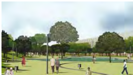
Parc del Lledoner