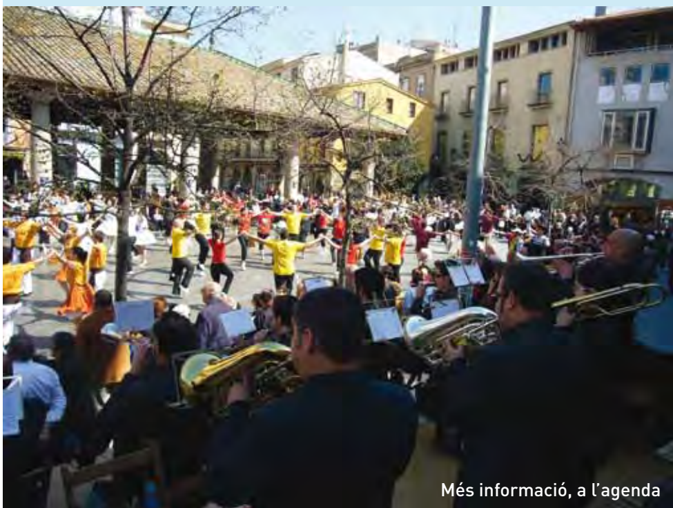
Més informació, a l'agenda

D'altra banda, la nostra ciutat serà l'escenari d'una nova actuació de la Roda d'Esbarts Infantils i Juvenils Catalònia, en què hi participaran grups de Sant Cugat, de Barcelona i de Manresa, al costat dels amfitrions, l'Esbart Dansaire de Granollers. La ballada serà dissabte 20 de març, a les 6 de la tarda, a la Porxada.