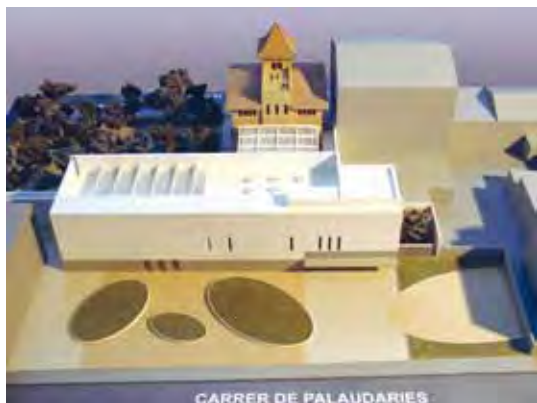
Ampliació del Museu de Ciències Naturals La Tela