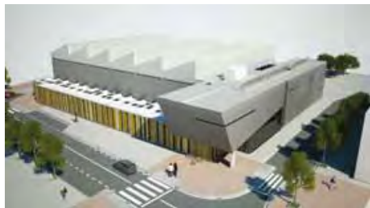
Pavelló del Congost i nou local social