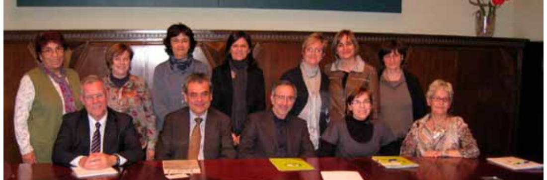
Fotografia de grup de les persones que han treballat en el projecte zona educativa de Granollers

L'Ajuntament de Granollers i el Departament d'Educació de la Generalitat han signat l'acord del projecte de la zona educativa de la ciutat per al període del 2010-2014. Aquest projecte recull l'anàlisi de la situació educativa a la ciutat, els objectius i les actuacions per als propers quatre anys. El Ple municipal del mes de febrer va acordar per unanimitat aquest projecte convertint Granollers en una de les primeres poblacions catalanes en aprovar-ho. El projecte és fruit de la participació i el compromís de tots els agents educatius de la ciutat, tant de centres públics com concertats, de l'Ajuntament i del Departament d'Educació, la inspecció educativa i els serveis educatius que formen la zona educativa.