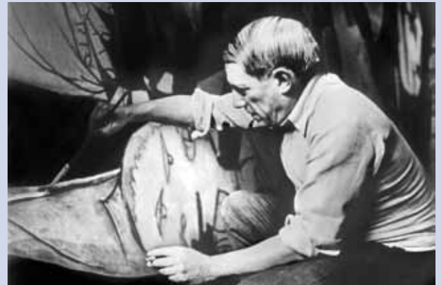
Dora Maar, Picasso treballant en el Guernica al taller de Grands-Agustins, 1937, París