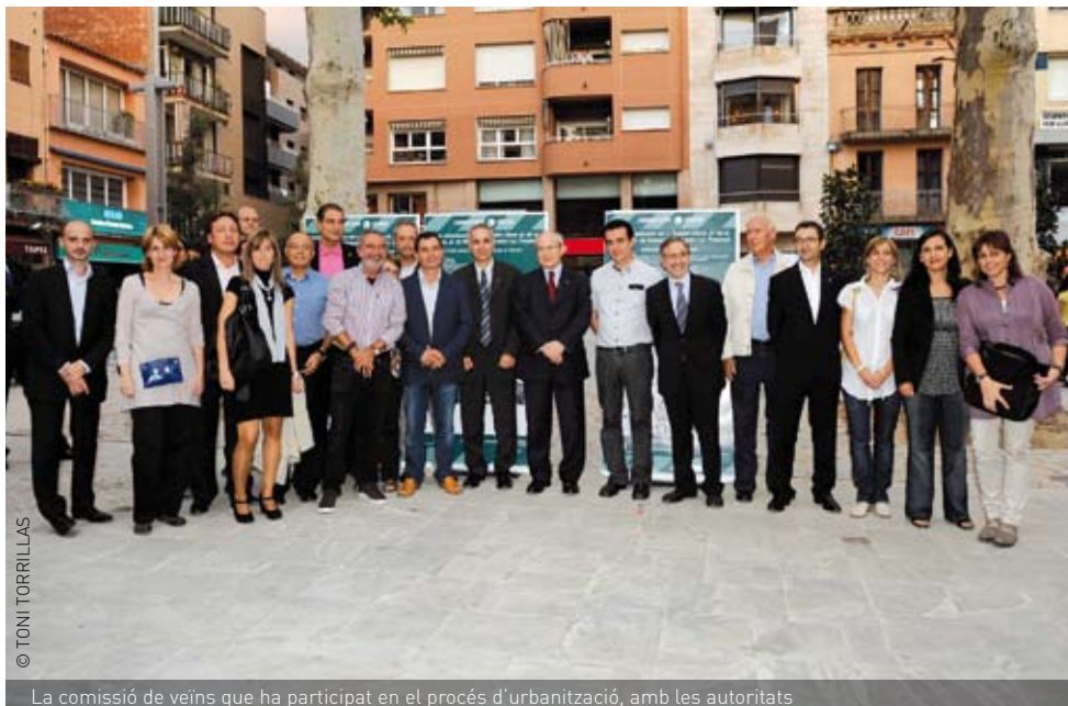
La comissió de veïns que ha participat en el procés d'urbanització, amb les autoritats