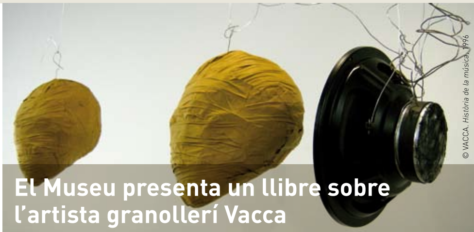
© VACCA. Història de la música, 1996