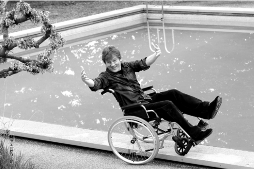
L'artista Pep Bou

Sobre la subhasta: www.moutepelsquiets.cat Bloc de Mou-te pels quiets: http://moutepelsquiets.blogspot.com Vídeo sobre com va córrer el Llullu: www.grup62.cat/www/grup62/ca/revista-autor/videos