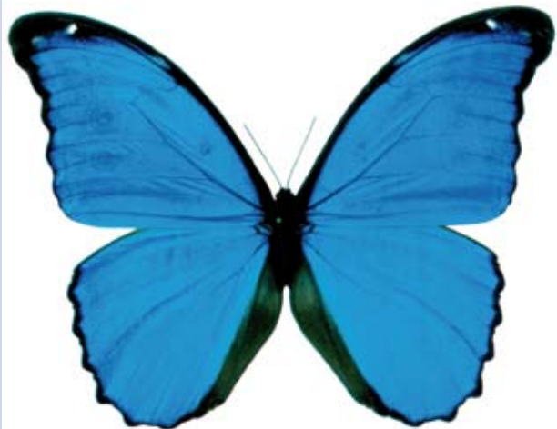
Aventura entomològica a la selva peruana a la Tela