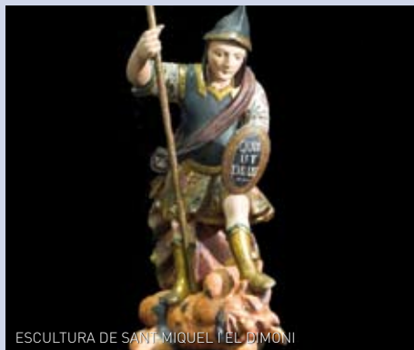
ESCULTURA DE SANT MIQUEL I EL DIMONI