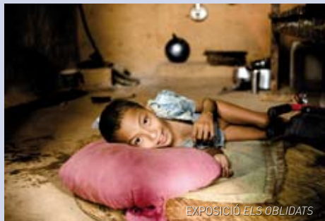
EXPOSICIÓ ELS OBLIDATS