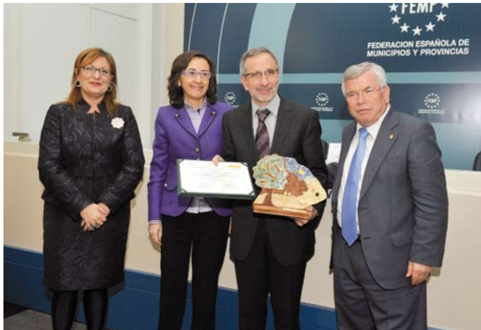
L'alcalde rep el premi de mans de la Ministra de Medio Ambiente, Medio Rural y Marino, Rosa Aguilar

El projecte "naturalització i creació d'habitats en el riu Congost al seu pas per la zona periurbana del Parc Firal" ha obtingut un premi valorat en 25.000 € al III Concurs de Projectes per a l'Increment de la Biodiversitat, que promou la Federación Española de Municipios y Provincias (FEMP) i el Ministerio de Medio Ambiente, Medio Rural y Marino.