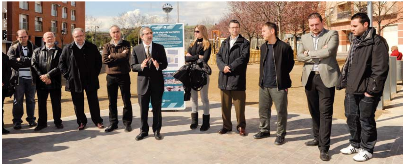
Inauguració de la plaça de les Hortes amb la presència de l'alcalde i diversos regidors

Ja han finalitzat les obres de reforma de la plaça de les Hortes, que han comportat la millora dels espais, la renovació de la totalitat de la pavimentació, mobiliari urbà i jocs infantils, així com nova vegetació que complementa l'existent. Així, s'han diferenciat petits espais d'acollida per a l'esbarjo infantil o per al descans que queden integrats, alhora, en un passeig. A la part central de la plaça s'ha deixat un gran espai diàfan on es podrà continuar fent activitats lúdiques