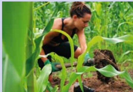
EXPOSICIÓ TUBAKOS AL CAMPS

CENTRE CÍVIC CAN BASSA Del 21 de juny a l'1 de juliol Inauguració: dia 21, a les 19.30 h Organitza: Xarxa de Centres Cívics i entitats de les juntes de centre