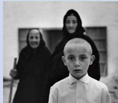
© TONI CATANY. EXPOSICIÓ NOVA AVANGUARDA

PLAÇA DE LA CORONA Paraules descalces. Dones fent pau Fotografies de Dani Lagartofernández Fins al 6 de juny