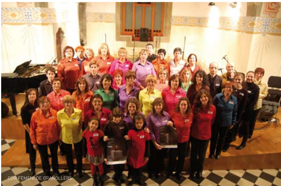
COR FEMENÍ DE GRANOLLERS