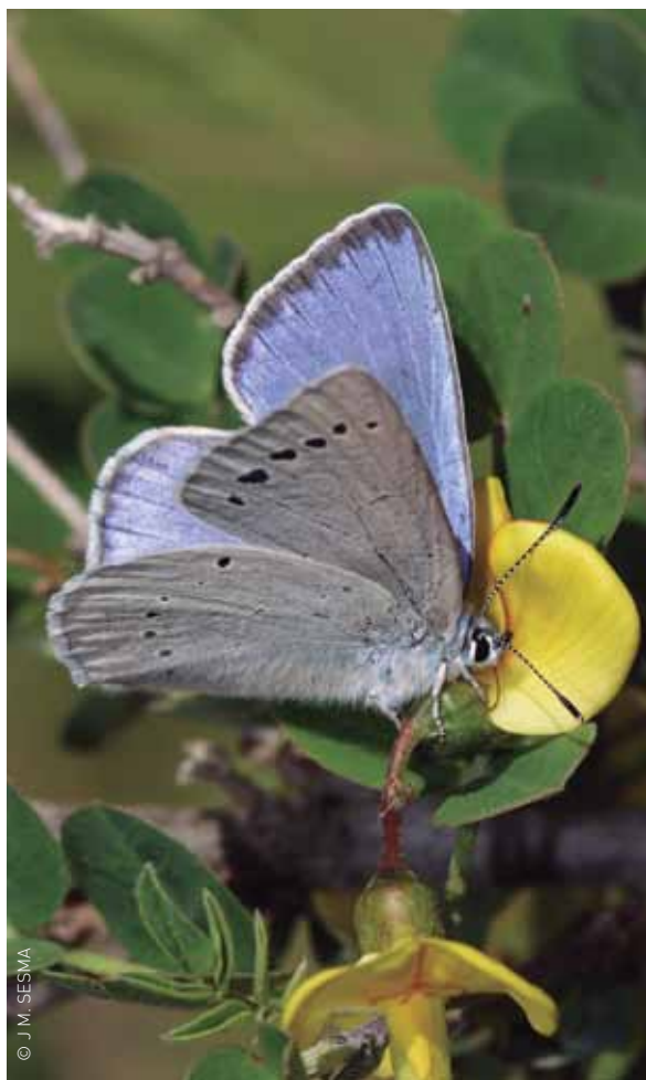
Una papallona lolana iolas .

Papallones i ocells estan en perill, segons un estudi amb implicació municipal. La prestigiosa revista Nature Climate Change ha publicat el resultat d'aquesta investigació, que revela un estrès tèrmic creixent en ambdós grups animals –considerats bioindicadors–, a causa del canvi climàtic. Els investigadors Constantí Stefanescu, del Museu de Granollers-Ciències Naturals; Lluís Brotons, del Centre Tecnològic Forestal de Catalunya, i Sergi Herrando, de l'Institut Català d'Ornitologia, han participat en aquest treball, realitzat amb suport logístic, organitzatiu i de gestió del Museu de La Tela. Amb aquest estudi, es demostra que, a causa de l'escalfament global del planeta, tant les papallones com els ocells europeus viuen, cada vegada més, allunyats de les seves àrees climàtiques òptimes, fet que els posa en perill. El Dr. Constantí Stefanescu ha explicat a Granollers Informa que “les respostes són molt més marcades als països nòrdics. Ara bé, a la nostra àrea, també hi juguen un paper important altres factors. “Per exemple” –afegeix Stefanescu–, “a l'àrea del Montseny, la pèrdua dels espais oberts, a causa de l'abandonament de les pràctiques agrícoles i ramaderes tradicionals, comporta la desaparició de moltes espècies”.