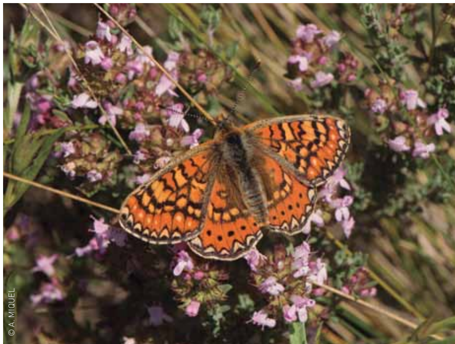
Una papallona Euphydryas desfontainii .