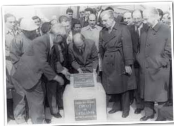
COL·LOCACIÓ DE LA PRIMERA PEDRA DEL CIRCUIT DE CATALUNYA, 24 DE FEBRER DE 1989