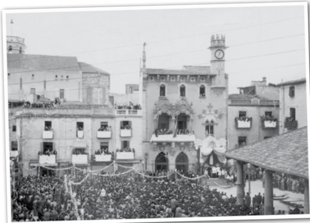
LA PL. DE LA PORXADA, CURULLA DE GENT, PARTICIPANT D'UN DELS ACTES RELIGIOSOS QUE ES VAN FER ENTRE EL 20 I EL 30 DE MARÇ DE 1952

8 DE MARÇ DE 2012 DIA INTERNACIONAL DE LES DONES IGUALTAT PER A CADA DIA