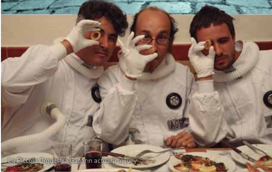
La Piccola Orquestra Gagarin actuarà al juny