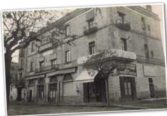
L'OFICINA DE "LA CAIXA" EN UNA IMATGE DE 1912.

El 29 de juny es complirà un segle des que "la Caixa" es va instal·lar a la nostra ciutat, a la plaça del Bestiar, avui plaça de Maluquer i Salvador. L'entitat commemora aquesta efemèride amb diferents activitats educatives, socials i culturals. Destaca una exposició de fotografies i documents relatius a la inauguració i els primers anys de presència de l'entitat a Granollers, que es podrà veure a la mateixa oficina central fins a final d'any.