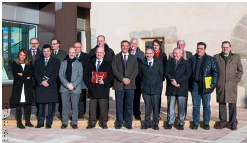
Els representants polítics dels 15 municipis que s'han unit en la Declaració de la C-17. La trobada s'ha fet a Granollers a Can Muntanyola. Centre de Serveis a les Empreses

ment urbanístic i de serveis, per al desplegament d'infraestructures, entre elles una bona xarxa de telecomunicacions en banda ampla mitjançant fibra òptica