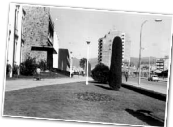
UNA IMATGE DEL RECENT ESTRENAT CARRER DE ROGER DE FLOR. LA NOVA URBANITZACIÓ VA AFAVORIR QUE S'HI INSTAL·LESSIN COMERÇOS.

El mes de gener de 1968 Granollers va estrenar la urbanització del carrer de Roger de Flor. Fins aleshores el carrer era de terra, sense voreres, tenia molts sots i s'enfangava especialment els dies de pluja. Aviat es va veure que el carrer tindria força trànsit ja que concentrava edificis i centres educatius: el Grupo Escolar Victoria, avui Ferrer i Guàrdia; l'Escola Municipal de Treball; i el Colegio Oficial de Enseñanza Media, que va desaparèixer al posar-se en marxa el nou institut, l'actual Antoni Cumella.