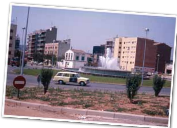
LA PLAÇA DE SERRAT I BONASTRE, ELS ANYS 70.

fins a uns deu metres. Amb la inauguració de la font lluminosa es celebrava l'arribada de l'aigua del Ter a la nostra ciutat. En la mateixa actuació també es va asfaltar el paviment del voltant del brollador i l'aparcament del davant de l'estació.