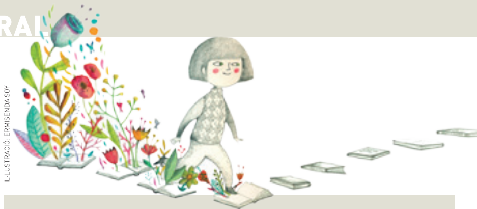
IL·LUSTRACIÓ: ERMISENDA SOY

22 h Parc Firal Festival Musik N Viu. 10 anys. Raska, Oques Grasses, La Troba Kung- Fú i Bu- hos. Més info, www.musiknviu.cat Promou: Servei de Joventut Org.: Jovent Ignorat