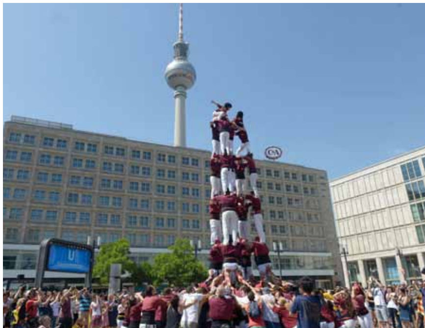
5 de 7 descarregat a Alexanderplatz

Fer castells a Berlín ha estat una fita històrica i inoblidable per als 194 castellers i castelleres dels Xics de Granollers que han viatjat a la capital alemanya. Fruit dels bons resultats tècnics, la colla ha estat convidada per actuar a Berlín dins del marc del Karneval der Kulturen i de l'esdeveniment organitzat per Òmnium Cultural, Human Towers for Democracy. Els Xics, atenent la crida del Casal Català de Berlín, han representat la cultura catalana al Carnaval de les Cultures, que se celebra des de 1966. És una gran festa que agrupa la diversitat cultural de Berlín. Hi participen uns 4.700 ballarins, músics i artistes de 80 països, i és seguit per més d'un milió d'espectadors. Els primers castells grans es van veure al mig d'una gran expectació. Els alemanys van quedar bocabadats de la tècnica castelleria i la colla va obsequiar als assistents amb castells, fermes i segurs, descarregats amb solvència i davant l'atenta mirada d'espectadors que veien castells per primera vegada a la seva vida. El 5 de 7 descarregat a les 12 h de diumenge 8 de juny a Alexanderplatz de Berlín pels Xics de Granollers va ser la contribució de la colla a l'esdeveniment Human Towers for Democracy, organitzat per Òmnium Cultural, per aixecar castells simultanis a les principals capitals europees. L'actual entrenador del Bayern de Munich, Pep Guardiola, ha actuat de padrí dels Xics de Granollers.