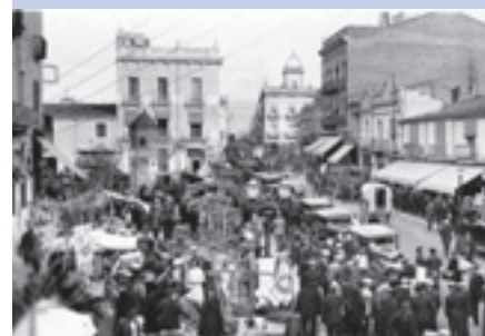
Mercat pl. Maluquer, any 1930-31.