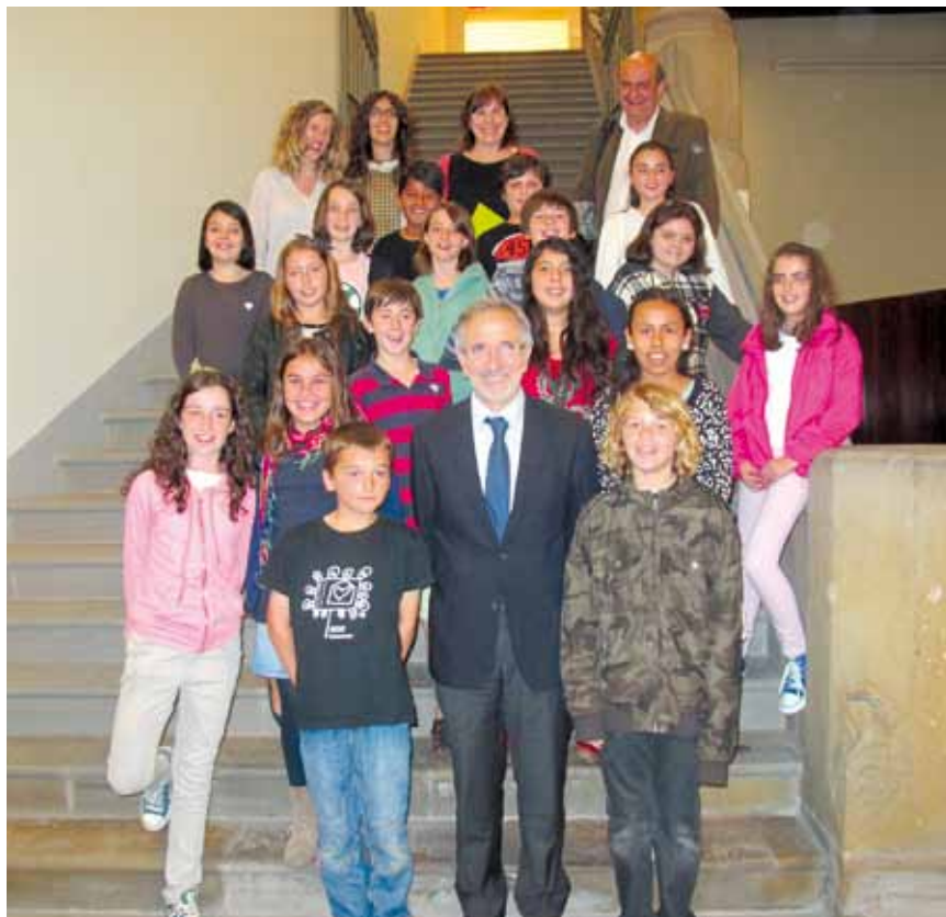
El Consell dels Infants després de l'Audiència amb l'alcalde

El consell valora l'existència dels Centres Oberts, que hi hagi una comissió per evitar l'absentisme escolar i que es donin beques. Però creuen que s'ha de millorar: "l'atenció per els infants amb discapacitat i que hi hagi més serveis de psicologia públics."